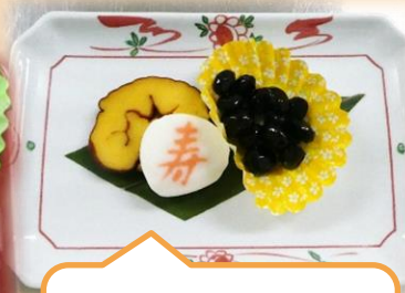
元旦朝食 祝い膳 さっくり餅のお雑煮