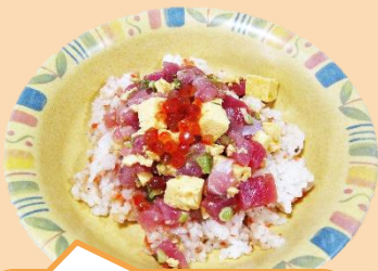
1月2日昼食 ちらし寿司・茶碗蒸し