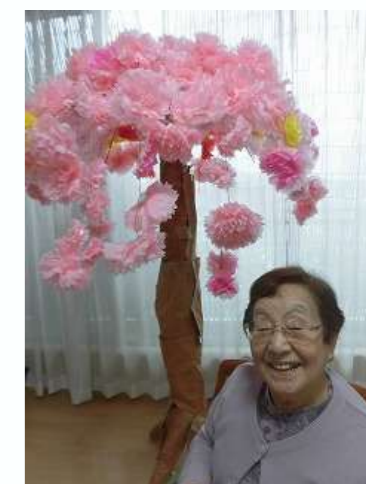
※写真撮影の為マスクを外しております