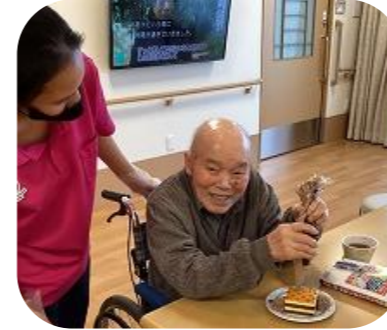
2号館西4階では、毎月利用者様の誕生日会を開催しています。ケーキにホイップクリームやフルーツをトッピングして頂いたりみんなで歌をうたったりと、とても楽しい時間になっています。